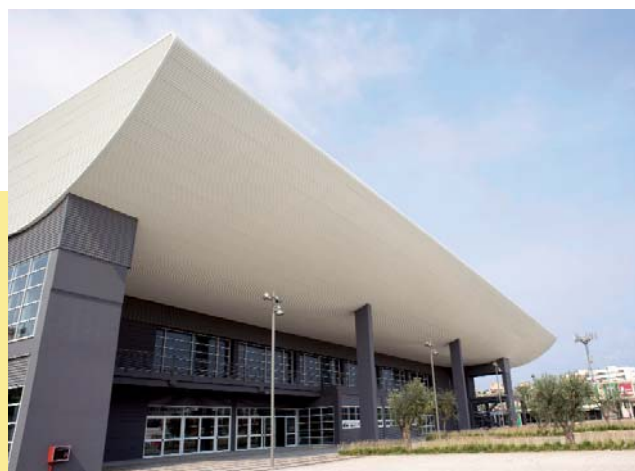
Veduta esterna/External view

La garanzia di qualità è assicurata dal tessuto in vinilpelle di produzione Anaunia, omologato dal Ministero degli Interni ai fini della prevenzione incendi certificato in classe di reazione al fuoco 1 (uno).