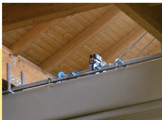
Dettagli del meccanismo di installazione Details of installed mechanism

Grazie alla partizione mobile a pacchetto Anaunia, palestre, padiglioni delle fiere, capannoni commerciali e industriali sono divisi in pochi istanti con la semplice pressione di un pulsante. Può essere installata, nel rispetto dell'architettura dell'edificio, in diverse situazioni strutturali e in ambienti dove la polivalenza degli spazi è un bisogno sociale ed economico e di risparmio energetico.